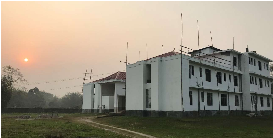
Bild: Gebäude in der Errichtungsphase